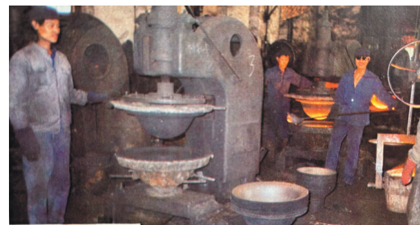
常州锅厂职工在生产铁锅